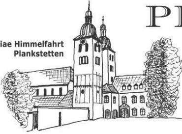
Mariae Himmelfahrt Plankstetten